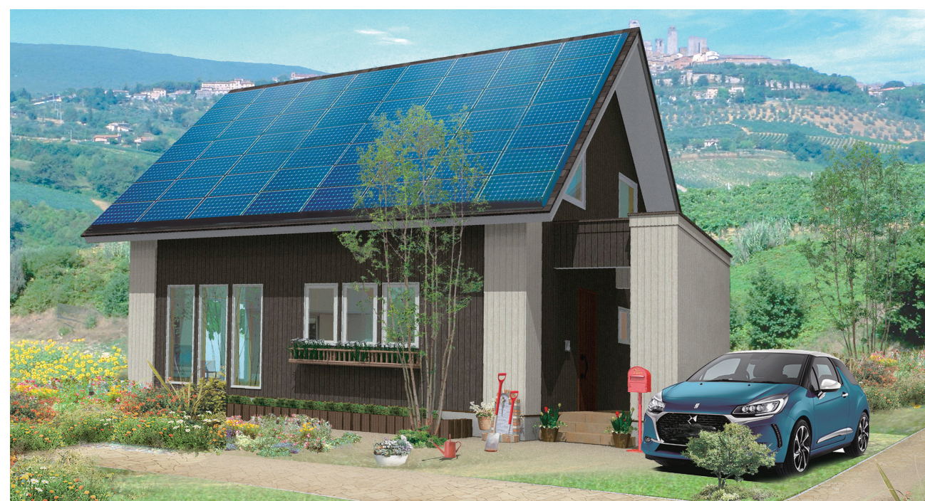
ハウス・オブ・ザ・イヤー・イン・エナジー特別優秀賞を連続受賞した「eco house ZeRo」

はい。しかしまだ、私たちは「ハウス・オブ・ザ・イヤー・イン・エナジー」の最優秀企業に贈られる「大賞」は手にしていません。大賞は北海道のような寒冷地に所在する企業を受賞したことは過去にないと伺っております。私たち住まいのウチイケは、北海道の代表として道内初の大賞受賞企業になることを目標に本年度も邁進していきたいと考えています。