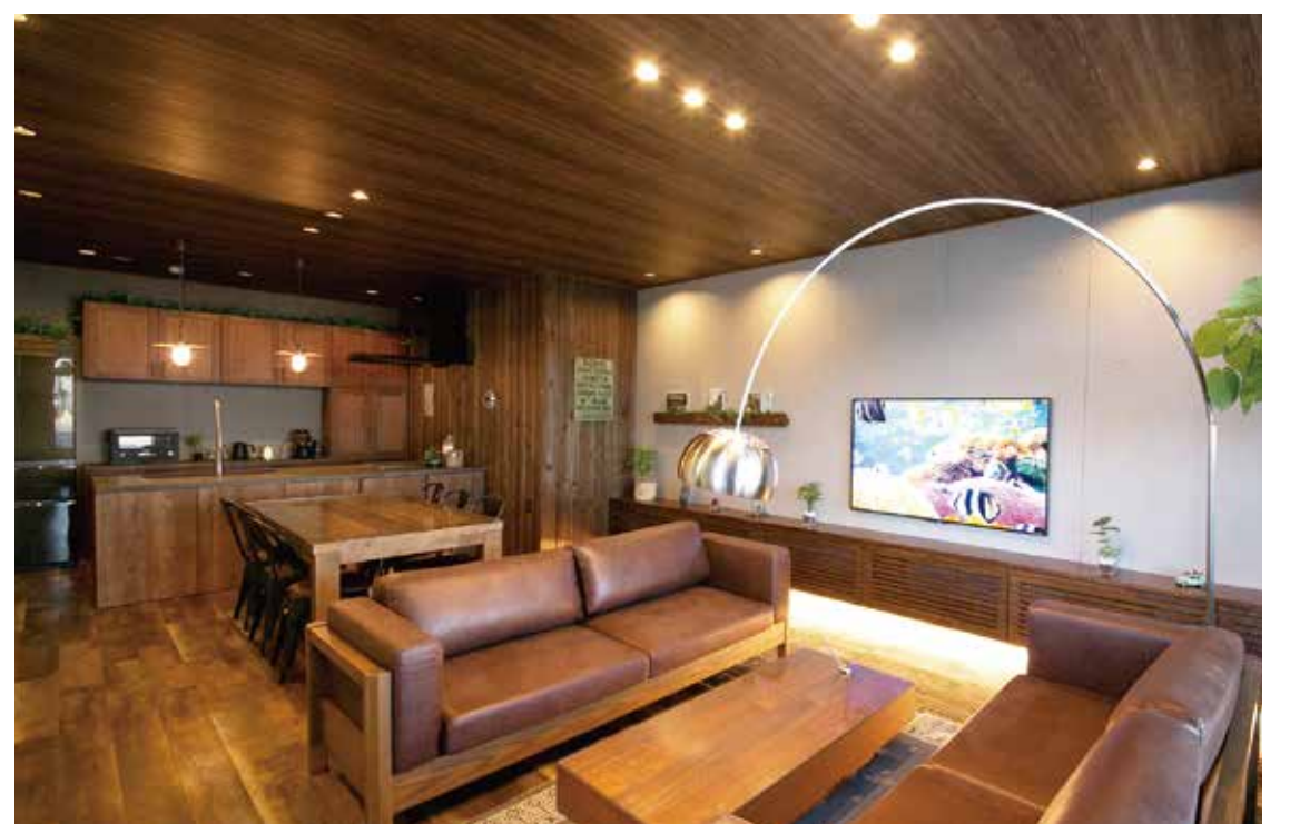
■リニューアルした苦小牧ショールーム