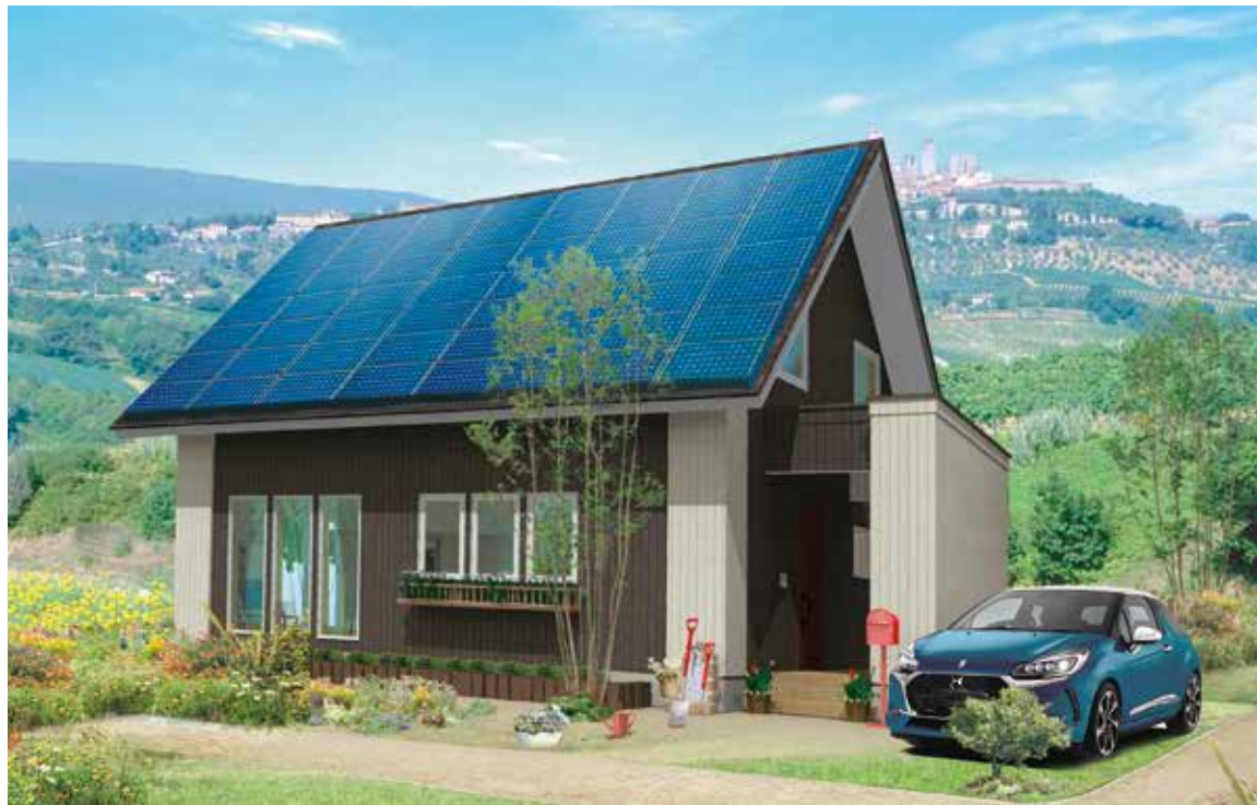
■ハウス・オブ・ザ・イヤー・イン・エナジー特別優秀賞を連続受賞した「ecohouse ZeRo」

賞にどのような住宅会社が参加しているのですか? 私たちは、総竣工棟数11棟以上、100棟未満のいわゆる中堅住宅メーカーが集まる激戦部門です。その中から大賞に選ば